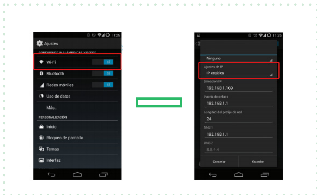
Imagen 2. Aplica la IP Estática a la red de conexión