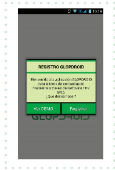
Imagen 3. Abrimos la aplicación y escogemos la opción Registrar

Escogemos la segunda opción para que nos aparezcan los datos necesarios para la instalación del módulo GlopDroid en nuestro Tpv y la conexión del mismo con el dispositivo Android.