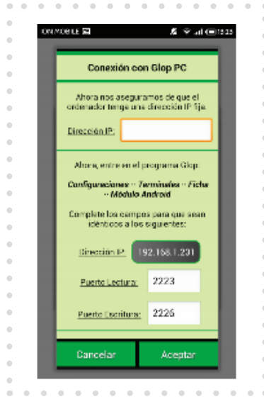
Imagen 4. Escribimos la IP del Tpv con el que conectará el dispositivo

Una vez pulsada la opción de Registrar, aparecerá otra ventana en la app en la que tenemos que escribir la IP del Tpv u ordenador en el que está el software Glop al que realizaremos las comandas (Imagen 4).