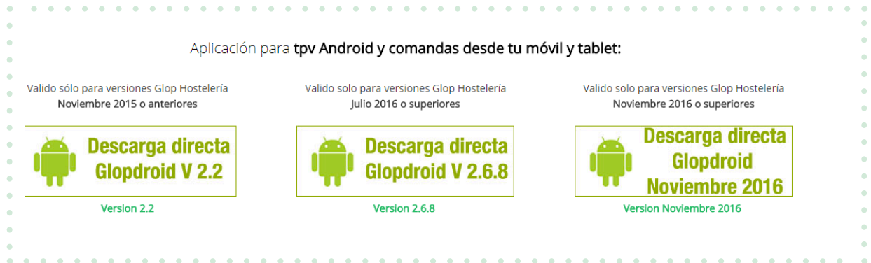
Imagen 1. Descarga la APP móvil desde www.glop.es

El primer paso es descargar la APP de GlopDroid de nuestra web www.glop.es Para encontrarla debes ir a la página del Módulos Adicionales / GlopDroid, dónde encontrarás el botón "Descarga APP Gratis" (Imagen 1).